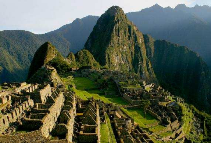
Pérou – Amérique du sud Site inca du Machu Picchu dans les Andes