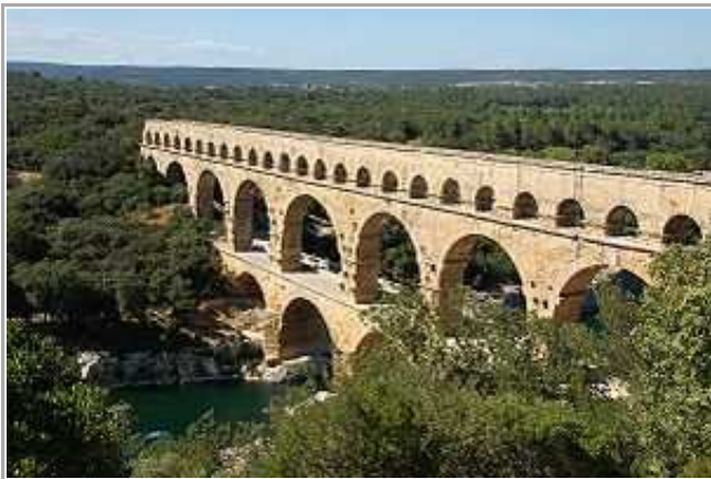
Le pont du Gard Pont-aqueduc romain à trois niveaux