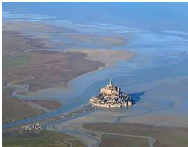
La baie du Mont Saint-Michel