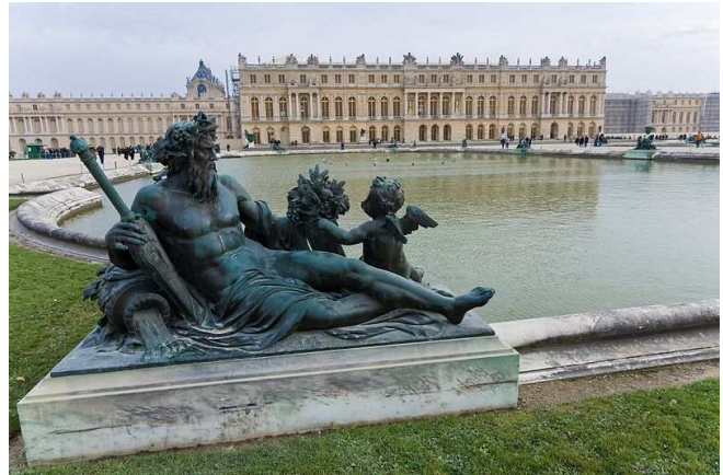
Parc et château de Versailles