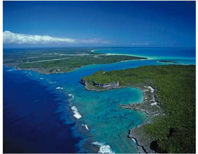
Australie Les lagons coralliens de Nouvelle Calédonie