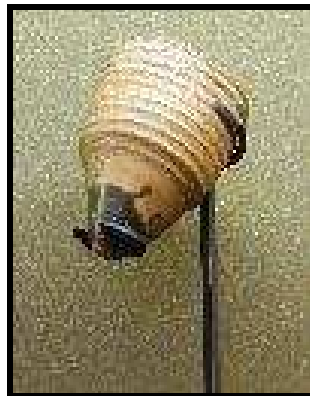
Deux toupies venant de la Grèce antique.