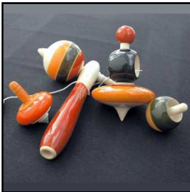
Des toupies indiennes.