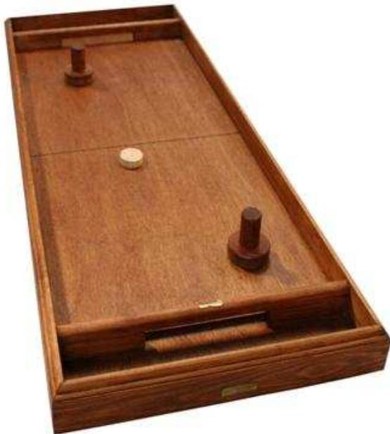
Table à Glisser.

Chaque joueur dispose de 6 palets en bois. Le premier joueur, tiré au sort, place 1 palet dans la zone de départ et tire à l'aide d'une queue dans la zone des toques. S'il passe au milieu des 2 premières toques, il marque 2 points, et passe la main au joueur suivant. Le but du jeu est de se rapprocher des zones marquées 5 ou 10 points, et de pousser les palets adverses dans la rigole. Lorsque tous les joueurs ont lancé leurs palets, on compte 1 point par palet resté sur le jeu (après les 2 premières toques) et 5 ou 10 points pour les palets qui touchent les cercles tracés sur le jeu.